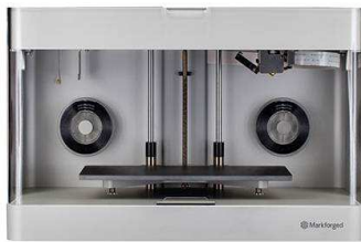
世界初カーボン3Dプリンタ