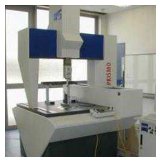
高速CNC三次元座標測定装置 (AMPI設備)