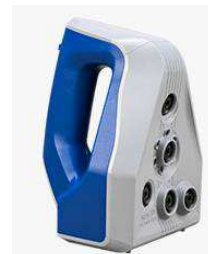
3Dハンディスキャナ