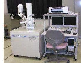
走査型電子顕微鏡