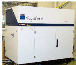
高集束レーザー加工装置