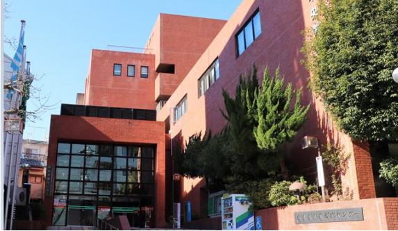
兵庫県中央労働センター