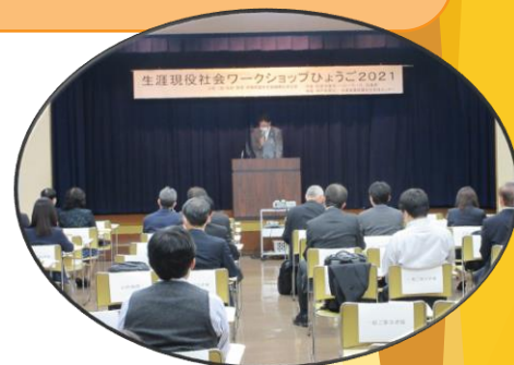
昨年の風景(コロナ対策のため来場者の間隔を確保して開催)