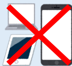
パソコン、タブレット、スマートフォン等