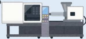
既存機器のデジタル化