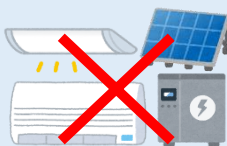
省エネ設備（空調、照明、太陽光発電設備、蓄電池等）

その他、補助対象の機器設備やソフトウェアであっても、一般価格や市場相場と比較し著しく高額なものは対象外となります。