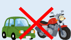
車両（自動車、バイク等）