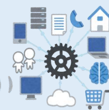
各種ソフトウェア